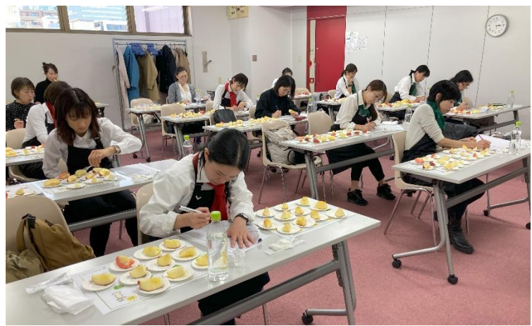
《当日の東京会場の様子：2023 年 11 月開催「第 2 回全国りんご選手権」》