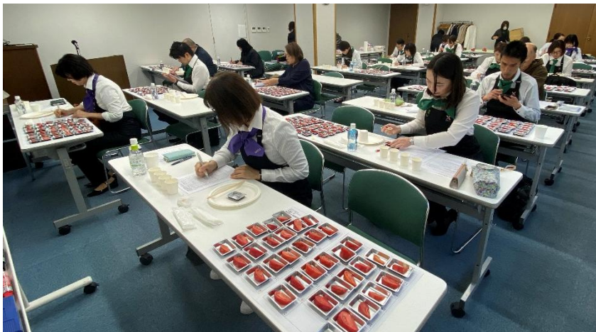
《当日の大阪会場の様子：2024 年 4 月開催「第 3 回全国トマト選手権（ミディアム・ラージ）」》