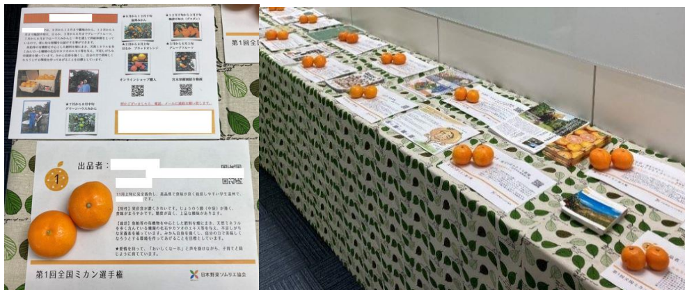
《展示例：2021年12月開催「全国ミカン選手権」》

A. 普段使用している青果物のチラシ・リーフレットを展示ブースに設置します。 さらに、本選手権で食味審査を行う評価員にも配布するため、 30枚程度の同封 をお願い致します。