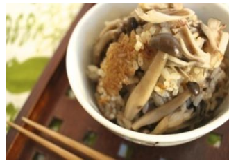
冷凍きのこの炊き込みご飯