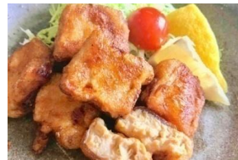
冷凍豆腐のから揚げ