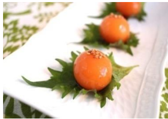
冷凍卵の醤油漬け