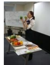
※料理教室イメージ写真