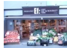
※野菜ソムリエの店エフ店舗外観